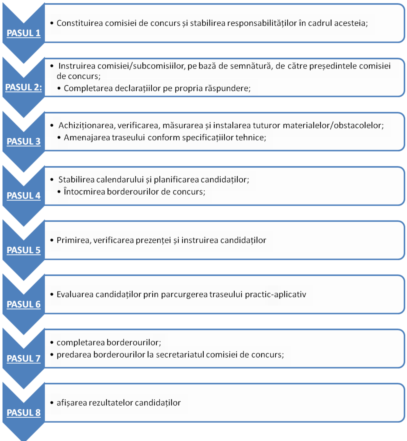
DIAGRAMA DE PROCES